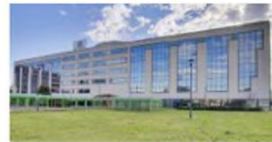
La sede di WITTENSTEIN S.P.A. a Sesto San Giovanni (MI)

Con circa 2.900 collaboratori in tutto il mondo WITTENSTEIN SE è sinonimo di innovazione, precisione ed eccellenza nelle trasmissioni meccatroniche. Sei divisioni sviluppano e commercializzano riduttori epicicloidali di precisione, attuatori rotativi e lineari, servoazionamenti, sistemi lineari a pignone e cremagliera, micromotori, componenti per le nanotecnologie e l'industria 4.0.