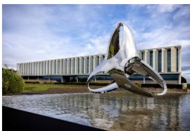
02 – WITTENSTEIN Logo-Skulptur